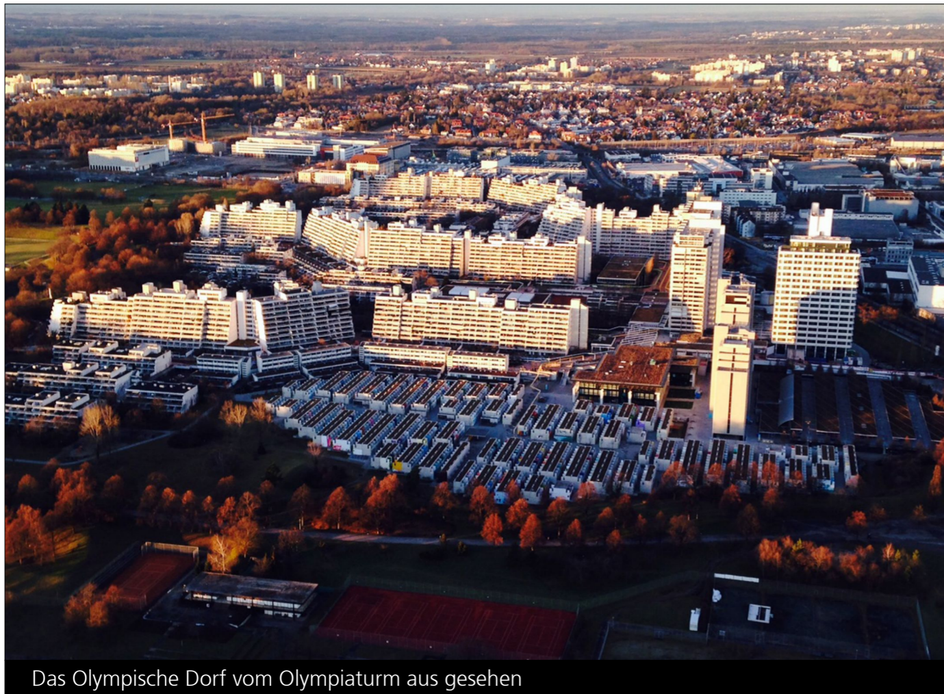
Das Olympische Dorf vom Olympiaturm aus gesehen